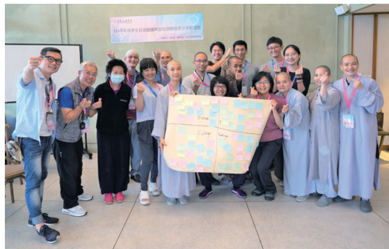
▲ 6月27至28日舉辦學生自治組織幹部培訓暨感恩分享研習營。

第二天是社團幹部經驗分享會，大家分享了自己在社團工作中的經驗和故事，也談到面臨的挑戰與克服困難的方法，並為新任幹部們提供實用的指導和建議。活動尾聲，參加培訓的學生們紛紛表示，兩天的活動讓他們對於領導力的認識更加深入，也獲得實踐與鍛煉的機會，希望學校未來能繼續舉辦此類活動，為同學們創造一個更有活力、有溫度的校園生活。