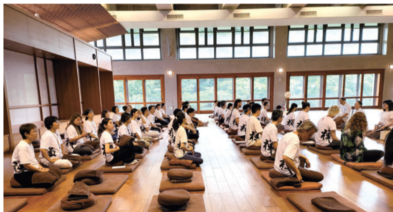
▲7月3日法鼓山洛杉磯道場北美青年法鼓山巡禮團來校。

8月26日，則有姊妹校日本立正大學佛教學部師生到訪，距離上次交流已將近有十年的時間。這次訪問將進一步加深兩校彼此間的合作關係，帶來更多共同的學術與文化交流機會。