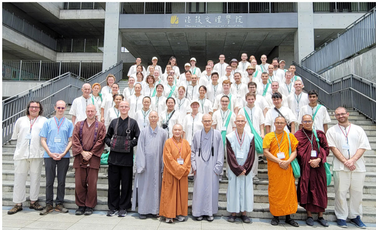
▲2023年木魚計畫國際青年佛學工作坊於7月22日至24日在本校舉行。