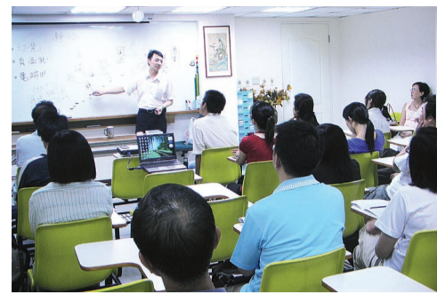
▲推廣教育中心暑期課程豐富多元，有興趣者可參見推廣教育中心部落格，為自己安排一個充實的暑期時光。

其中，語文方面的「梵文初階」與「日文初階」課程，承襲往年良好的風評，以每週二次，每次二小時的形式進行，在學習上鬆緊適宜，可同時獲得學習的樂