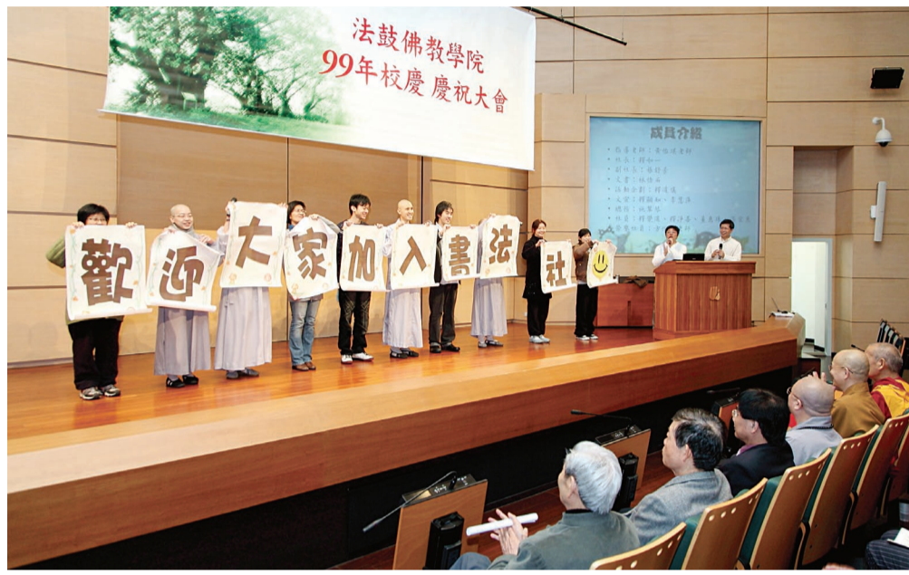
▲本校於4月8日以「社團交流·身心健康」為主題，歡度創校三週年校慶。

典禮上，除了回顧一年來的大事，各個社團也善用音像語言和科技呈現社團成果，例如桌球社製作逗趣短片招募社員、行願社以音樂劇展演社團宗旨，而國畫社則在會場上展出社員的書畫作品，多元互動的表演，不僅創意十足，也促進了各社團間的觀摩與交流。當天下午，桌球社還特別舉辦了桌球比賽，讓師生在運動中練習觀照身心的變化，體驗動中禪悅。