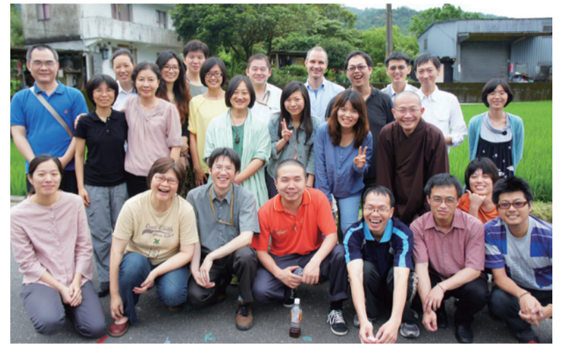
▲ 佛典數位化的過程，除了龐大的文獻整理，也需要專業人員經驗技術的累積與傳承。

透過以上的努力成果，期望不僅是帶給學術界豐沛的學術研究資源，並期待能廣泛推廣給社會大眾，展現數位佛學典藏的珍貴價值，引發對佛學資源的重視。