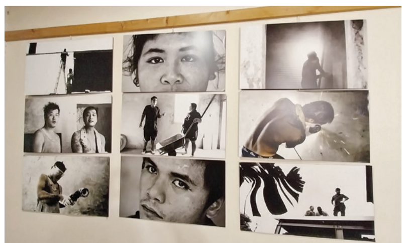
▲ 何老師特地将重建過程中的合作夥伴照片掛在老屋中。