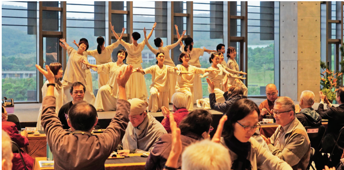
▲心聚團帶來表演「禪心樂舞」。

表演開始前，由副校長果鏡法師引導大眾體驗茶禪開始。靜心品茶談公案已成為同學們校園生活的重要篇章，感恩音樂會邀請捐資菩薩們共同體驗。果鏡法師鼓勵大家以身心放鬆、體驗、欣賞、享受的心境，即是契入禪修的方法和精進，定心品茶，靜心觀賞人基會心聚團帶來的「禪心樂舞」演出，藉此體驗渾然一體的身心和諧。舞者以起、承、