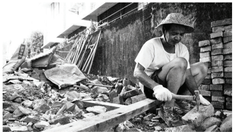
▲ 溫和拆除老屋磚牆，盡可能保留瓦片與紅磚的完整性以利於重複使用。