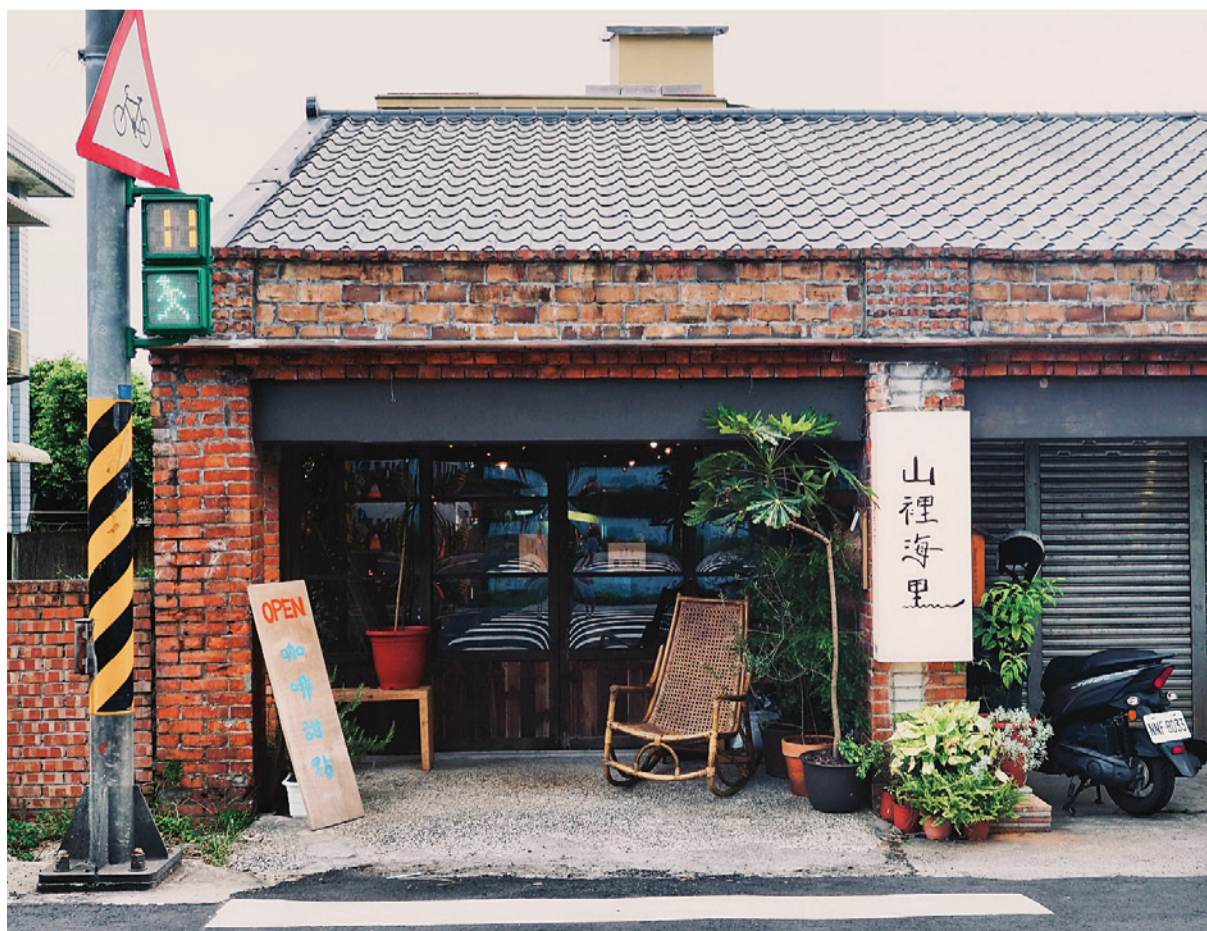
▲ 位於金山、萬里之間的老屋，重建過程使用傳統工法，處處充滿巧思。