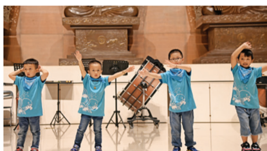
▲ 金美附設幼稚園小朋友的表演，萌到最高點。

方丈和尚果暉法師開場致詞，以「菩薩清涼月，常遊畢竟空；眾生心垢淨，菩提月現前」鼓勵大眾，心境清淨，菩提月光便能普照心田。晚會表演由在地嘉賓共同擔綱，首先由萬里國中鼓隊以專心一致的凝聚力、爆發力，震鼓響天，表達「鼓聲秋滿」的祝願；金山高中管樂團去年演出廣受好評，今年再度由首席指揮陳一夫老師帶領，帶來「木星」、「風之舞」，以及灌籃高手主題曲「直到世界盡頭」等高難度曲目，專業演奏之姿驚艷全場。金美國小「心花開」街舞一開場便嗨翻現場，萬里國中鼓隊也忍不住全體助陣共舞！金美附設幼稚園小朋友，帶來臺語民謠，半說半唱，純真可愛，萌到最高點。最後，法鼓山合唱團多聲部天籟之音，鄭史佩團長首次以阿卡貝拉形態重新編曲「送別」，演唱方丈和尚果暉法師作詞之