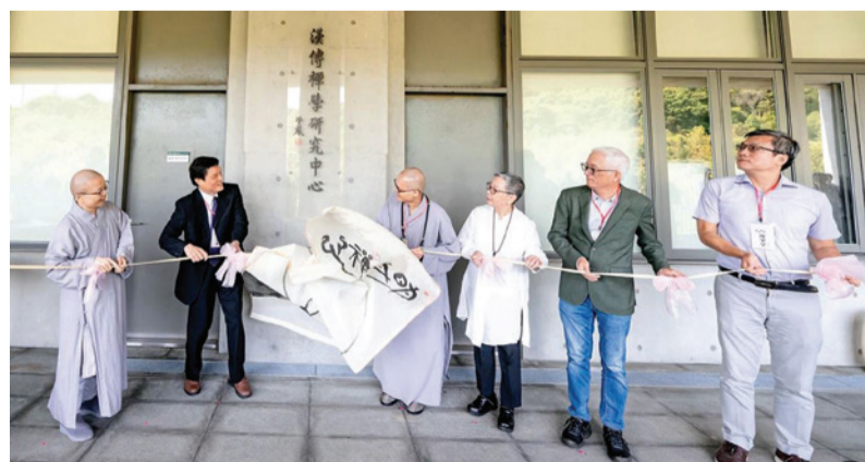
▲2024年8月31日漢傳禪學研究中心揭牌。

陳定銘校長表示，該中心的成立將結合佛教學系與人文社會學群資源，推動跨領域的禪學研究與應用。副校長暨中心