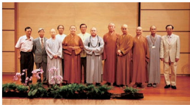
▲ 啟展典禮上，各界貴賓齊聚一堂，見證這段佛法慧命弘傳里程。

本校的前身中華佛學研究所，歷經數十年的辛勤耕耘，今年正式邁向三十而立之年！為見證這段佛法慧命弘傳的里程，本校與佛研所合作，於法鼓山教育行政大樓二樓與五樓，舉辦了「30+3 成果回顧展」。並在6月13日下午，於教育行政大樓國際會議廳舉辦啟展典禮，兩百多位各界貴賓、護法大德們，都出席這場盛大的啟展活動。