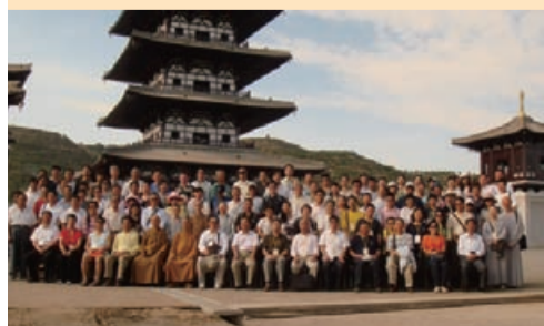
▲考察團員們齊聚大雲寺前合影。

七月天氣像烘焙機，雖然太陽很熱情，荷包也緊實，但還是大方地給自己一份邁向四十的生日法禮——「中國古剎與石窟巡禮」。與好友組成四人團自助旅行，先參訪杭州、天台古剎，行程中以參學與分享的心情，把握機緣將學校的佛學數位典藏資源與CBETA使用操