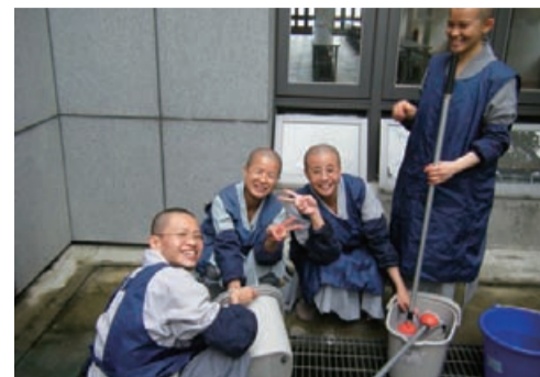
▲ 服務眾生，學習奉獻，是來到法鼓山最大的收穫。

雖然「服務學習」這門課是零學分，但卻是我修持中該得的滿分。身為菩薩道的行者，我們的職志就是「服務學習」——服務眾生，學習奉獻。來到法鼓山最大的收穫，不僅僅是佛學知識的增長，更重要