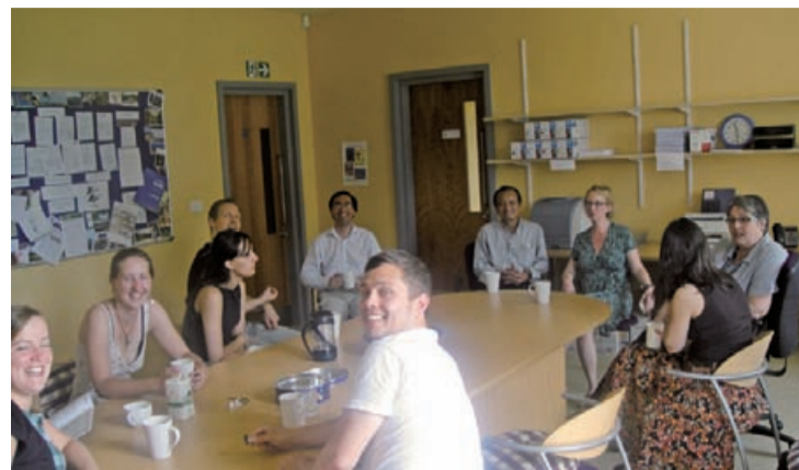
▲本校社副校長參訪牛津正念中心，並與該中心小組成員交流討論。

該中心主要是希望利用禪修的正念（Mindfulness）概念，把佛學、心理治療與學術研究等三方面整合在一起，用以治療人們的慢性病，尤其是因心理壓力而引發的疾病，例如：憂鬱症、恐慌症、慢性疼痛等，在過去的二十年來，這樣的治療方式在美國已經蔚為風尚。該中心認為正念的練習有四個階段：一、練習控制自己的心，使其不受到外界環境的影響。二、把自己放在總是會讓自己焦慮的環境中。三、探討自己在這環境中為何會焦慮？我們總是注意到了什麼讓我們焦慮？如何捨